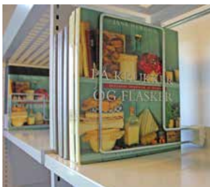
Standard hög modell