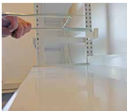
Bokstöden är demonterat

Demontera endast bokstöden när det är absolut nödvändigt eftersom plastbeslaget utsätts för slitage varje gång det monteras och demonteras.