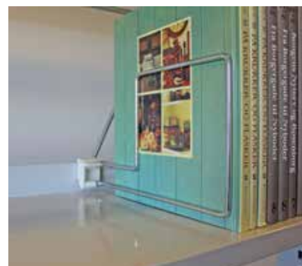
Spegelvänd modell hyllplansdjup 30 cm