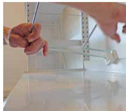
Vrid övre delen av metallramen åt HÖGER (MOT plastbeslaget)