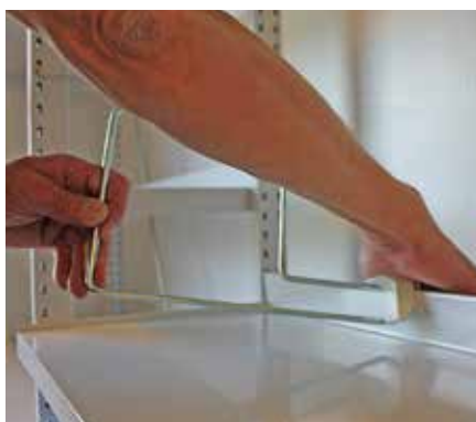
Pressa med hela handflatan