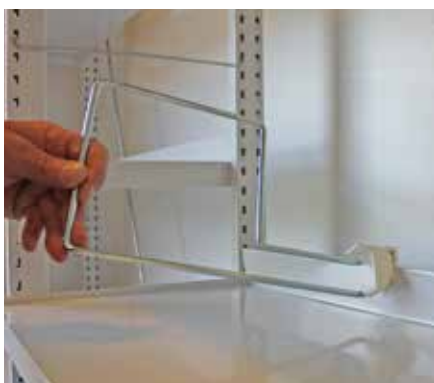
Placera plastbeslaget ovanpå bakkanten

Bakkantsbokstödet monteras på bakkantslisten på hyllplanet genom att placera plastbeslaget ovanpå bakkantslisten och sedan pressa med hela handflatan tills det är fast förankrat.