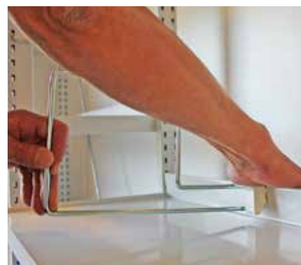
Pressa tills det är fast förankrat (man hör ett klickande ljud)