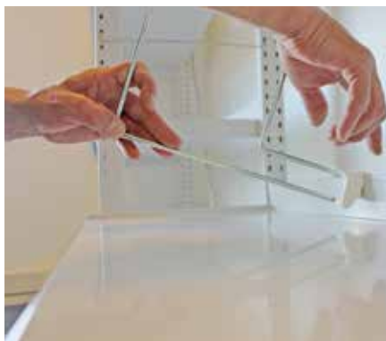
Lyft framkanten på metallramen ca. 10 cm