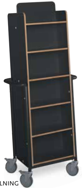
XL PLUS, UTSTÄLLNING

En enkelsidig bokvagn med snedställda hyllplan. Kapacitet: Ca. 100 normalvolymmer. Format: B1010 x D350 x H1090 mm.