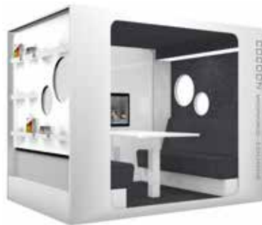
Cocoon Working-Lounge Exclusive

Skapa en zon för studenter och arbetsgrupper med Cocoon Working-lounge.