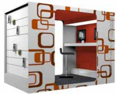
Cocoon Computer-Lounge XL